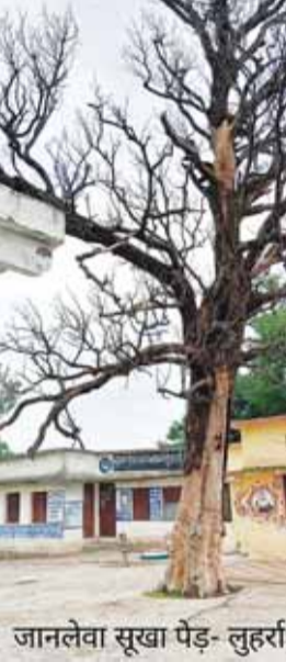
जानलेवा सूखा पेड़- लुहरा

वर्तमान में हम ग्राम पंचायत लुहरा में वर्षों से संचालित शासकीय माध्यमिक शाला की बात कर रहे हैं। जहां पर मिडिल शाला के बच्चों को बैठने के लिए तीन भवन, एक प्रधानाध्यापक कक्ष एवं एक हाल बना हुआ है। किंतु 10 वर्ष से इस शाला का एक भी कमरा बरसात के